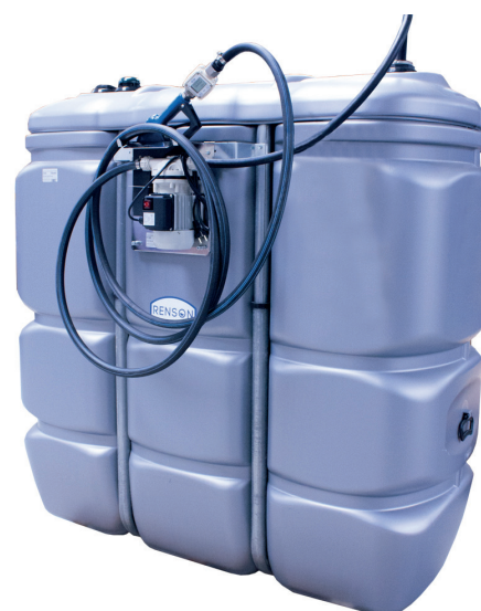
VERSION 2000L ET 1500L