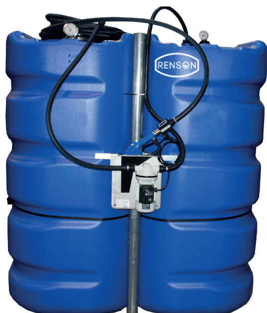
VERSION 3000L ET 2400L