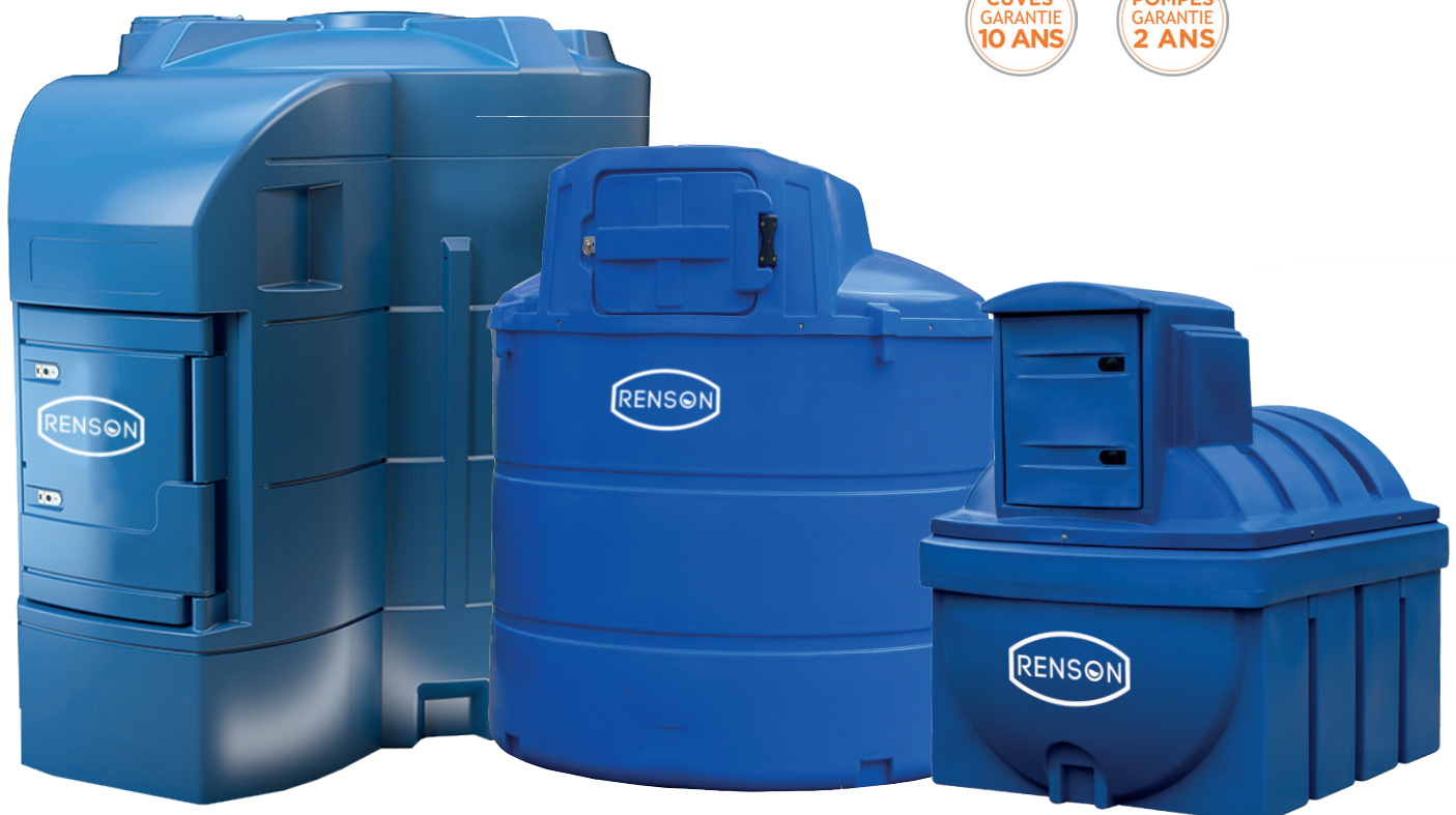
VERSION 9000 L