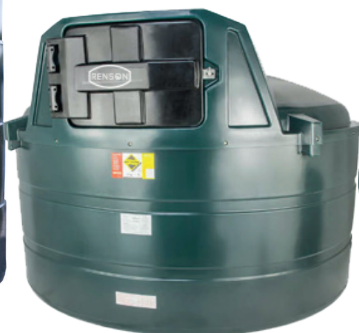
VERSION 5000L , 3500L ET 2400L