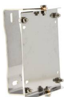
SUPPORT MURAL PIVOTANT POUR ENROULEUR INOX