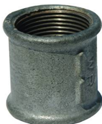
MANCHON DROITE & GAUCHE GALVA N°271 FF 1"