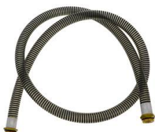
FLEXIBLE DE JONCTION Ø 25MM 2M AVEC RACCORD TOURNANT