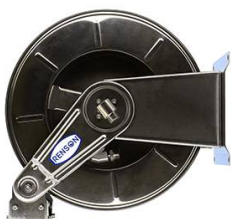
ENROULEUR INOX POUR GASOIL EQUIPE FLEXIBLE 10M EN 3/4"