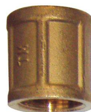
MANCHON LAITON FF 1"