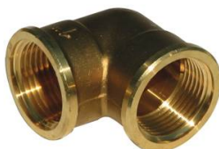
COUDE 90° LAITON 90L FF 1"