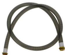
FLEXIBLE DE JONCTION Ø 25MM 2M AVEC RACCORD TOURNANT