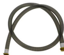
FLEXIBLE DE JONCTION Ø 25MM 1,5M AVEC RACCORD TOURNANT