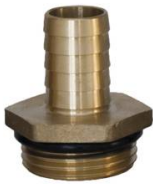
RACCORD CANNELE LAITON MALE 1" x 20