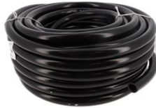
COURONNE 25M TUYAU SOUPLE PVC 20 BARS DIAMETRE 20