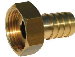
MANCHETTE CANNELEE LAITON ECROU TOURNANT F1" x 20