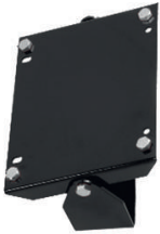
SUPPORT MURAL PIVOTANT POUR ENROULEUR ACIER