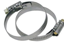
COLLIER DE SERRAGE W4 TOUR ET VIS EN INOX DIAMETRE 20-32