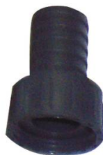
MANCHETTE CANNELEE PP FEMELLE 1" x 20