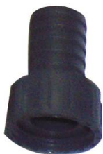
MANCHETTE CANNELEE PP FEMELLE 3/4" x 20