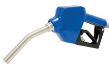
PISTOLET AUTO ADBLUE 45L/M CORPS ACIER CANNELE INOX Ø19MM