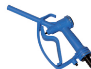
PISTOLET VERSEUR ADBLUE® BEC PLASTIQUE Ø 19MM