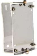
SUPPORT MURAL PIVOTANT POUR ENROULEUR INOX