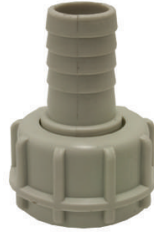
RACCORD CANNELE PP Ø 20MM FEMELLE 1"