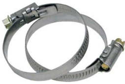
COLLIER DE SERRAGE W4 TOUR ET VIS EN INOX DIAMETRE 20-32