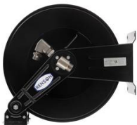
ENROULEUR AUTOMATIQUE ACIER NU