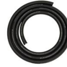
METRE TUYAU REFOULEMENT ADBLUE RENFORCE Ø 20MM