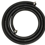
FLEXIBLE REFOULEMENT ADBLUE 4M RENFORCE Ø 20MM