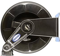
ENROULEUR INOX POUR ADBLUE EQUIPE FLEXIBLE 10M EN 3/4"