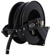
ENROULEUR ACIER POUR ADBLUE EQUIPE FLEXIBLE 10M EN 3/4"