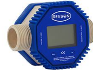
COMPTEUR NUMERIQUE ADBLUE AVEC RACCORD INOX FF 1"