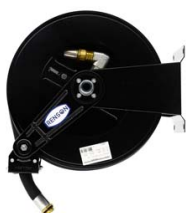
ENROULEUR ACIER POUR GASOIL EQUIPE FLEXIBLE 15M EN 1"