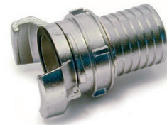
1/2 RACCORD CANNELE ALU VERROU DOUILLE REDUITE DN100