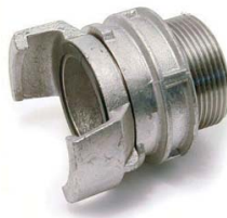
1/2 RACCORD MALE ALU AVEC VERROU DN100 4"