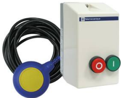
KIT MARCHE ARRET AUTO 12-18A AVEC FLOTTEUR 20M