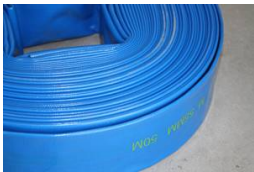
TUYAU PLAT - COURONNE 50M DIAMETRE INTERIEUR - 100 MM