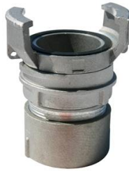
1/2 RACCORD FEMELLE ALU AVEC VERROU DN80 3"