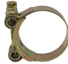
COLLIER DE SERRAGE TOURILLON W1 ACIER ZINGUE DIAMETRE 92-97