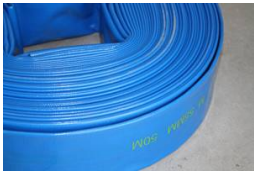
TUYAU PLAT - COURONNE 50M DIAMETRE INTERIEUR - 90 MM