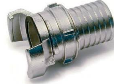
1/2 RACCORD CANNELE ALU AVEC VERROU DN80