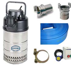
COFFRET POMPE 825127 KIT ACCESSOIRES 825145