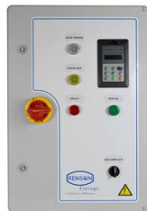
ARM PRESS CONST 2,2 KW <100M CAPTEUR CABLE 10M