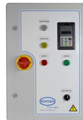
ARM PRESS CONST 2,2KW <200M CAPTEUR REACTANCE CABLE 10M