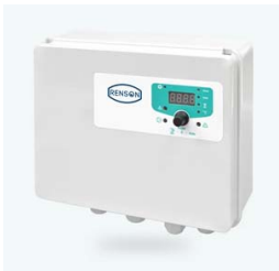
COFFRET MANQUE EAU BI TENSION 16A