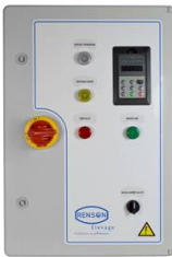
ARM PRESS CONST 2,2KW <200M CAPTEUR REACTANCE CABLE 10M