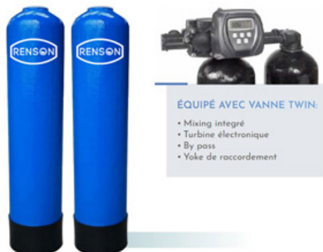
ÉQUIPÉ AVEC VANNE TWIN: