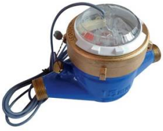
COMPTEUR D'EAU DN 40