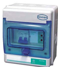
COFFRET CONTRÔLE REMPLISSAGE POUR CUVE A EAU