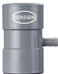
COLLECTEUR DE GOUTTIERE FILTRANT DN80/100