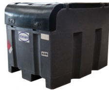
CUVE DE RAVITAILLEMENT 400L POMPE 12V 50L/MIN