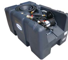
CUVE RAVITAILLEMENT 200L POMPE 12V 40L/M - 4M