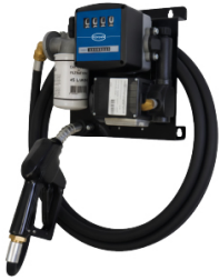
STATION FUEL ESSENTIEL+ 50L/M 230V - PISTOLET AUTOMATIQUE