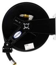
ENROULEUR ACIER POUR GASOIL EQUIPE FLEXIBLE 8M EN 1"