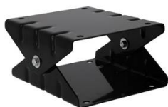
SUPPORT MURAL PIVOTANT POUR ENROULEUR ACIER/ABS