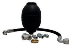
KIT ANTI COUP DE BELIER POUR NETTOYEUR HAUTE PRESSION