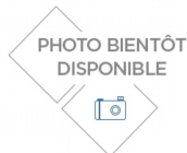
KIT ENROULEUR HP 20M MAX POUR NHP TRIO / TRIO FLECTOR