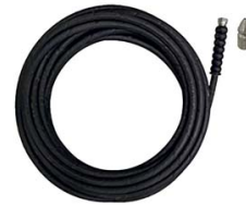
KIT DEBOUCHAGE DE CANALISATION AVEC FLEXIBLE HP 20M