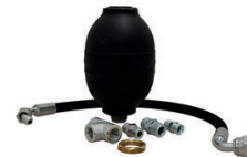
KIT ANTI COUP DE BELIER POUR NETTOYEUR HAUTE PRESSION