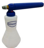
CANON A MOUSSE 2L STANDARD POUR DEBIT ENTRE 14 A 21L/MIN