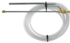
KIT DE SABLAGE CALIBRE 045 MALE EURO