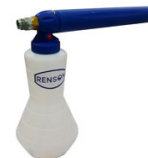
CANON A MOUSSE 2L STANDARD POUR DEBIT ENTRE 14 A 21L/MIN