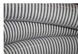
TUYAU SPIRALE - AU METRE DIAMETRE INTERIEUR - 70 MM