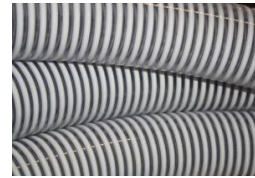
TUYAU SPIRALE - AU METRE DIAMETRE INTERIEUR - 55 MM