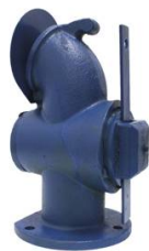
ROBINET DE TONNE A BOISSEAU PASSAGE 60MM -3 TROUS