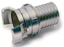
1/2 RACCORD CANNELE ALU AVEC VERROU DN50