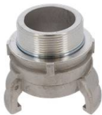
DEMI RACCORD MALE 2" AVEC VERROU DN 50