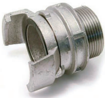
1/2 RACCORD MALE ALU AVEC VERROU DN65 2''1/2