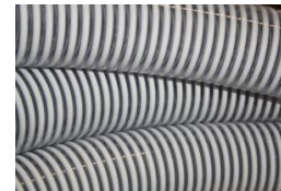
TUYAU SPIRALE - AU METRE DIAMETRE INTERIEUR - 25 MM