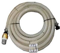
KIT ASPIRATION 7M Ø 20MM MALE 1" AVEC CREPINE A CLAPET