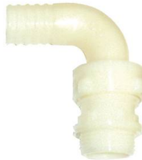
COUDE 3 PIECES CANNELE NYLON MALE 1" x 25